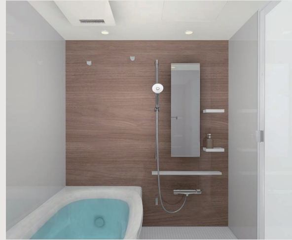
壁パネル: ウォールナット柄(一面) ※水栓は位置・形状が異なる場合があります。

カウンター側の壁一面にウォールナット柄のアクセントパネルを採用し、温かみと落ち着きのある空間を演出。ホワイト鏡面パネルとやわらかな光が1日の疲れを癒してくれる居心地の良いバスルーム。