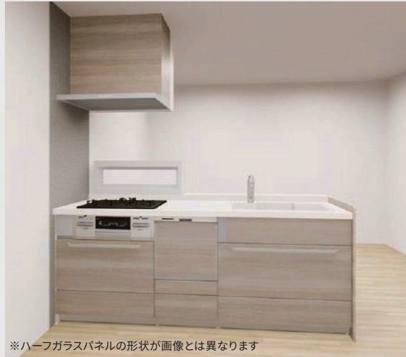
※ハーフガラスパネルの形状が画像とは異なります

温もりと質感のあるカラーで、インテリアとしても楽しめるキッチン。キャビネット内は湿気やカビに強いステンレス素材、またキッチンパネルはマグネット仕様等、細かい使い勝手にも配慮しています。